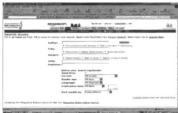
图 2 查询接口示例

(3) 搜索引擎对结果的排序是根据搜索结果与所提交查询的相似性,Web 数据库则是根据结果中某个属性的值.